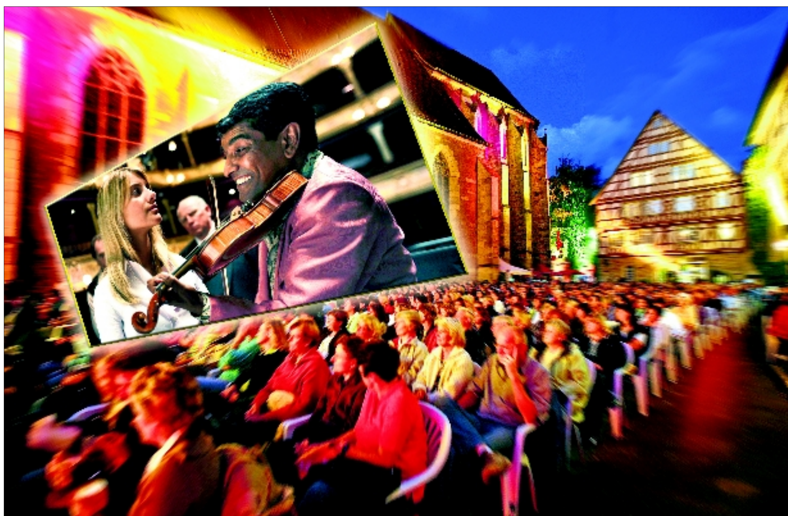
Das Spiel geht in die Verlängerung: Im „Nachspiel“ läuft unter anderem auch der Streifen „Das Konzert“.

Insgesamt betreten seit Beginn des Sommernachtskinos am 12. August laut Veranstalter 7 600 Cineasten den mehr oder weniger trockenen roten Teppich. In der gleichen Zeitspanne 2009 waren es rund 11 000 Besucher, zieht Fischer einen Vergleich.